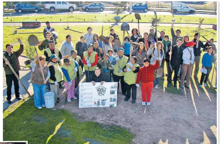
Los vecinos diseñan junto a Mi Parque los proyectos de forestación en sitios eriazos. Luego, la municipalidad respectiva los autoriza para llevarlos a cabo.

Desde su creación en 2007 Mi Parque ha inaugurado seis plazas en las comunas