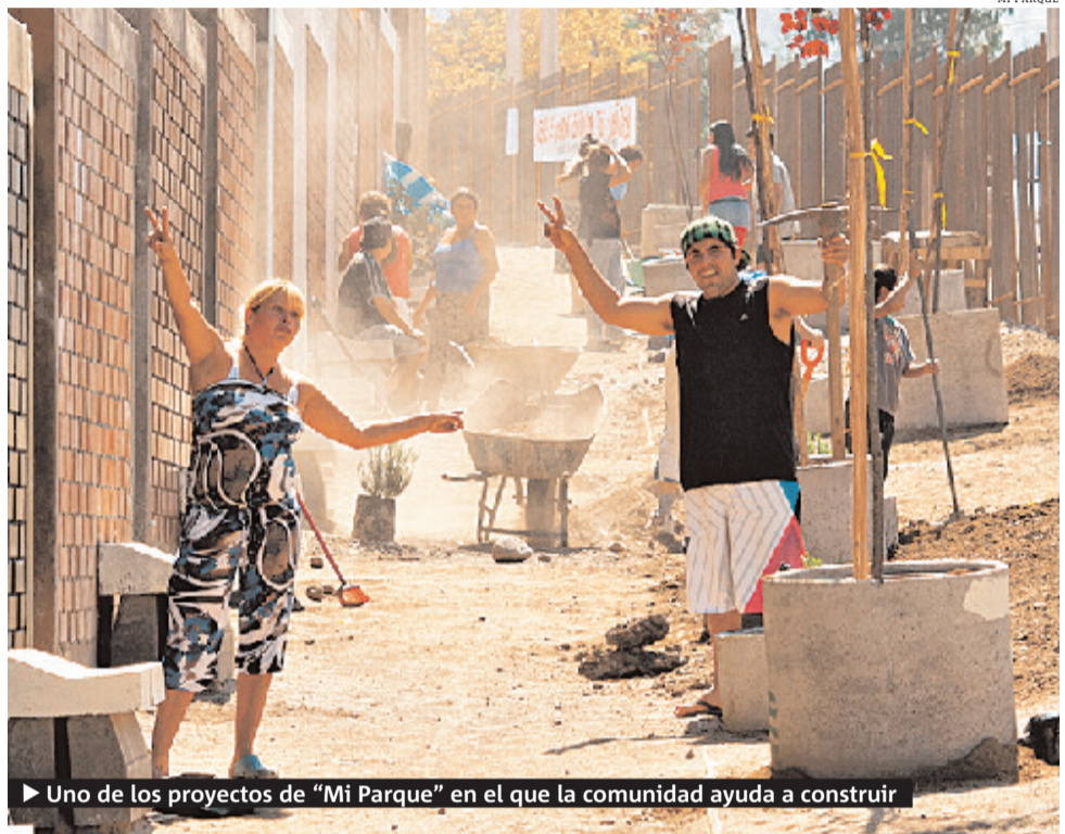
► Uno de los proyectos de “Mi Parque” en el que la comunidad ayuda a construir