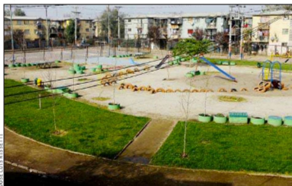
MANOS A LA OBRA. — Fueron los vecinos los que limpiaron, pintaron y plantaron sus plazas. Así luce ahora la plaza de la Villa San Luis, en Renca.

Los resultados revelaron que después de trabajar en sus plazas, el 63% de los encuestados dijo que confía más en sus vecinos, el 64%